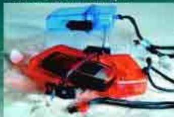
Beach box, resistente all'acqua