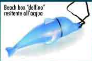
Beach box "delfino" resistente all'acqua